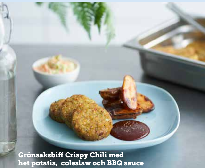
Grönsaksbiff Crispy Chili med het potatis, coleslaw och BBQ sauce

En riktigt god grönsaksbiff gjord på svenska råvaror med moderna smaker. Lecora Grönsaksbiff Crispy Chili är en saftig biff med en härlig struktur och crunch från quinoa och solrosfrön, kryddat med chili och curry. Dessutom är den glutenfri och innehåller varken ägg eller laktos vilket gör att den är enkel att laga till många. Grönsaksbiff är en av de vanligaste och mest populära rätterna i skolan. Och här kommer en ny favorit till menyn, gjord på svenska råvaror.