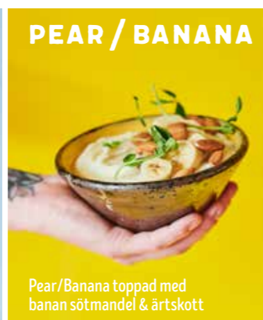
PEAR / BANANA

Mixa Natural med bladspenat - snabbt och enkelt en mättande smoothie