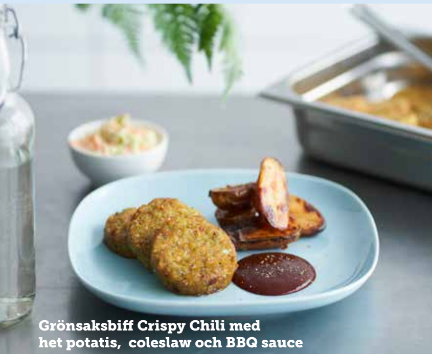
Grönsaksbiff Crispy Chili med het potatis, coleslaw och BBQ sauce

En riktigt god grönsaksbiff gjord på svenska råvaror med moderna smaker. Lecora Grönsaksbiff Crispy Chili är en saftig biff med en härlig struktur och crunch från quinoa och solrosfrön, kryddat med chili och curry. Dessutom är den glutenfri och innehåller varken ägg eller laktos vilket gör att den är enkel att laga till många. Grönsaksbiff är en av de vanligaste och mest populära rätterna i skolan. Och här kommer en ny favorit till menyn, gjord på svenska råvaror.